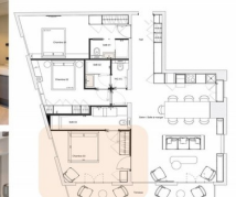
Photos APPARTEMENT - CHAMBRE 3 / master

AFIM S.A.M., 3 av. de Grande Bretagne, 98000 Monaco, Tél. +377 97 97 87 87, afim@afim.mc