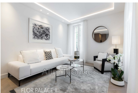
FLOR PALACE II

Document non contractuel 06/03/2021 - Prix T.T.C